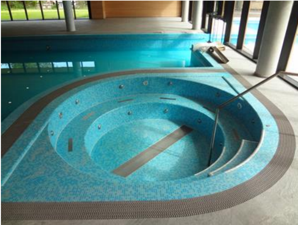
Bild 6: Besonders aufwändig gestaltete sich die nachträgliche Abdichtung des Whirlpools: Über 30 Einbauteile waren in die Abdichtung zu integrieren.