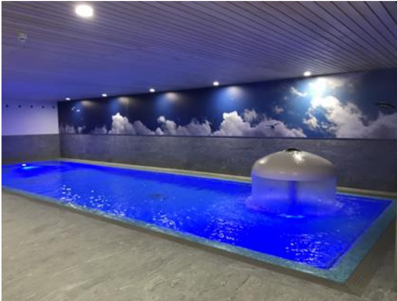
Bild 10 und 11: Der Wellnessbereich mit drei Schwimmbecken und verschiedenen Saunen bietet den Gästen Erholung auf über 2.500 Quadratmetern.