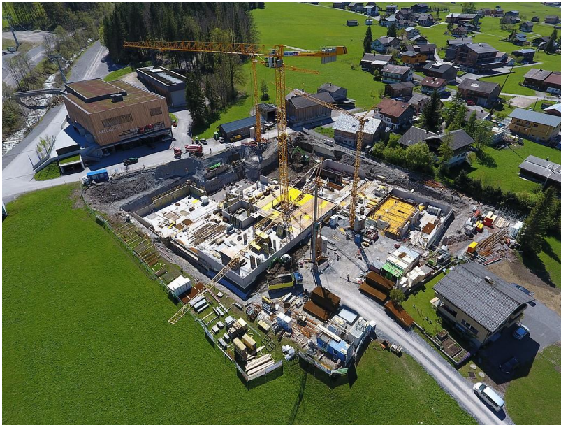
Bild 1: Großbaustelle in Mellau: das Hotel „Die Wälderin“ mit rund 250 Betten und einem großzügig angelegten Wellnessbereich. Bauherr, Planer und die ausführende Firma Fliesenpool GmbH in Nenzing entschieden sich für die PCI Augsburg GmbH als Baustoff-Partner bei der Fliesen- und Mosaikverlegung. Der führende Hersteller von bauchemischen Produkten lieferte die passenden Produkte sowie Beratung und Unterstützung bei der Ausführung.