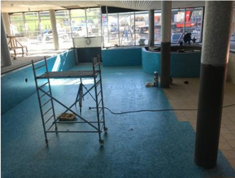
Bild 2: Die drei Schwimmbecken wurden mit wasserundurchlässigem Beton und entsprechenden Zusätzen hergestellt und eine zweite Dichtebene nachträglich mit PCI Seccoral 2K Rapid eingebaut. Die schnell-abbindende Sicherheits-Dichtschlämme bietet durch rissefreies Aushärten und ihren entkoppelnden und spannungsabbauenden Eigenschaften dauerhafte Sicherheit und Dichtheit.