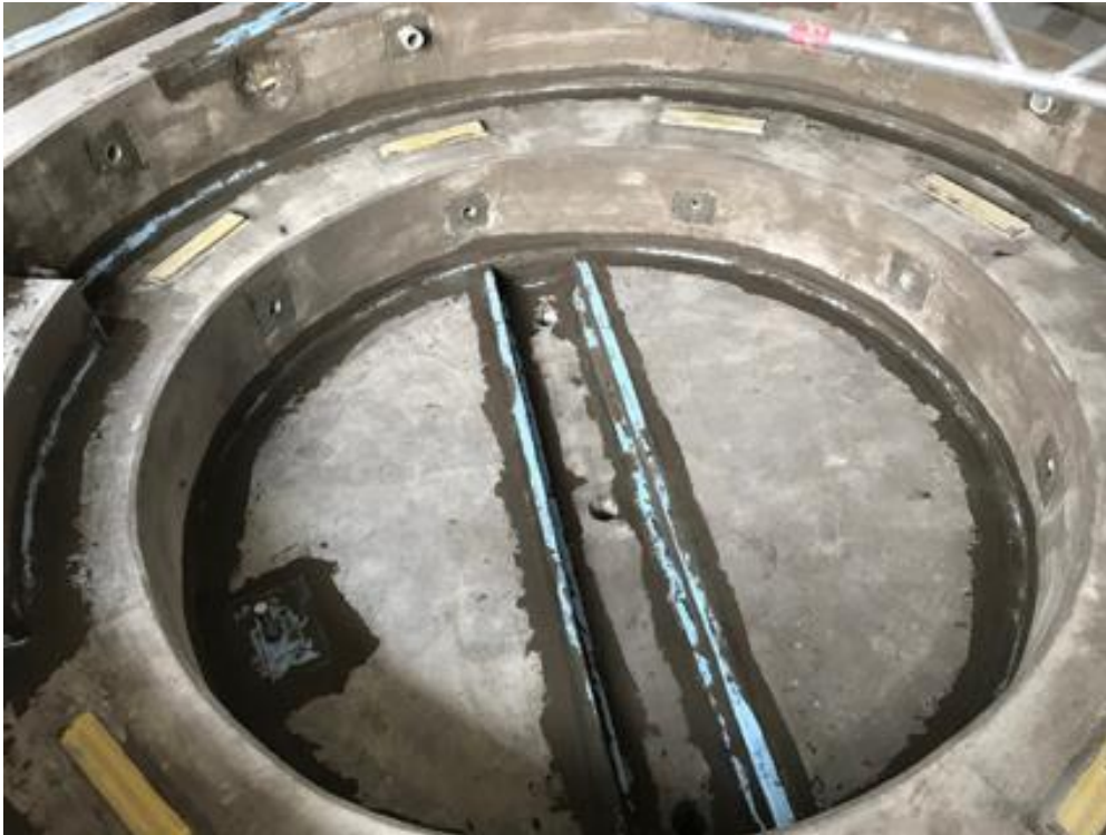
Bild 5: Neuralgische Stellen wie Anschlüsse dichten die Handwerker mit PCI Pectape ab.