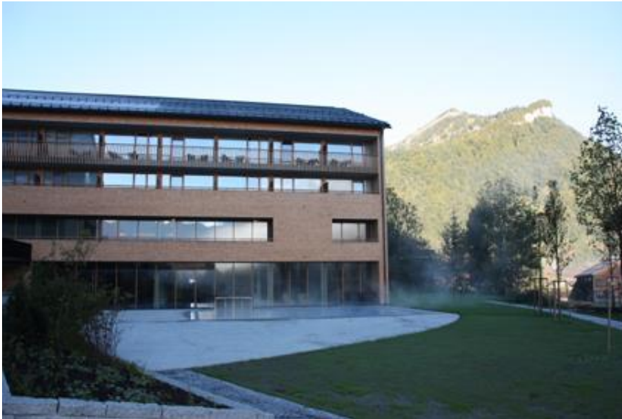
Bild 8 und 9: Nach 18 Monaten Bauzeit und einer Investition von rund 28 Millionen Euro wurde das moderne Hotel „Die Wälderin“ in Mellau im September 2018 eröffnet.